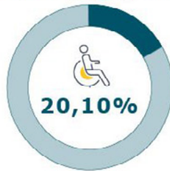
Erkrankungen des Skelett- und Bewegungsapparates